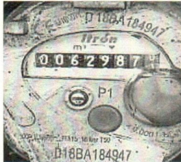
Lect 629 – 02 enero/2024