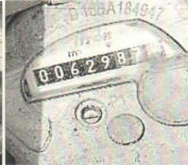
Lect 629 – 01 febrero/2024