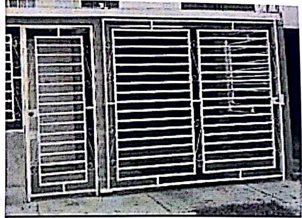
Lect Sin Acceso – 2 julio/2023