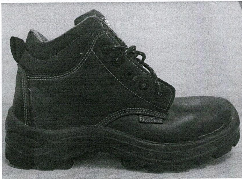
Diseño de la bota en cuero