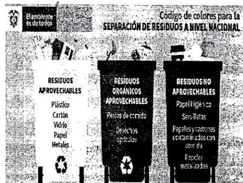
Figura 2. Código de Colores Para Separación de Residuos a Nivel Nacional.

El Departamento de Gestión Ambiental, es el responsable de la identificación y especificación de las características técnicas requeridas para la ejecución del contrato.