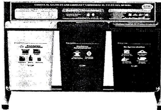
Figura 1. Punto ecológico con tablero y soporte.