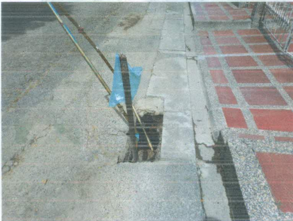
Imagen 2 y 3: daño presentado en la actualmente