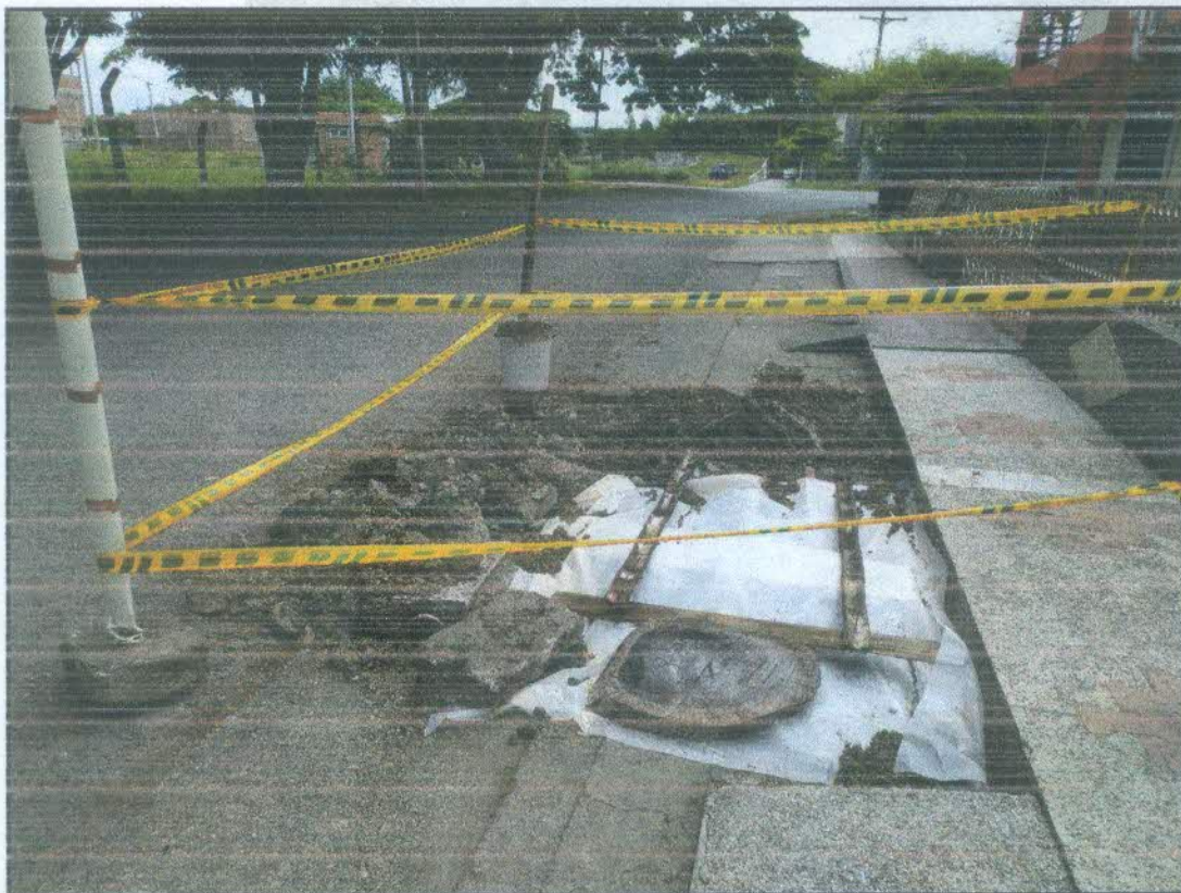
Imagen 1: daños presentados en el año 2021, una casa antes