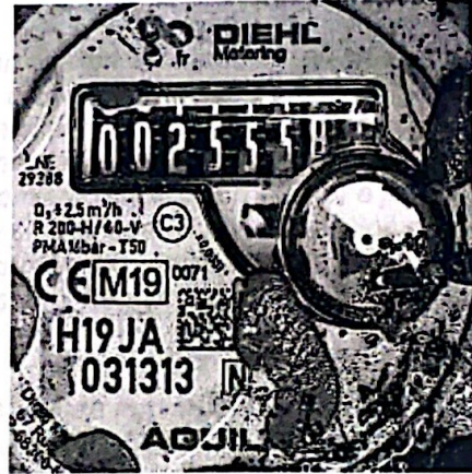
Lect 255 – 02/abril/2023