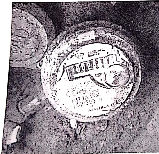
Lect 28 – 1 octubre 2022