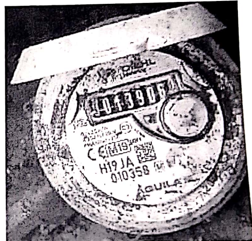
Lect 139 – 1 noviembre 2022