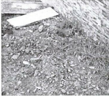
Lect Sin Acceso – 26 julio/2022