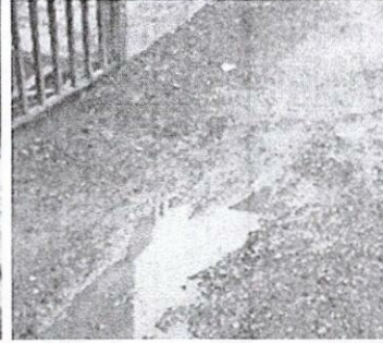
Lect Sin Acceso – 26 mayo/2022

En vista de lo anterior y teniendo cuenta que mediante su solicitud se evidencia un mayor consumo facturado, esta operadora procederá a ajustar 137m 3 del consumo facturado.