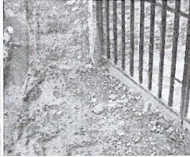
Lect Sin Acceso – 26 junio/2022