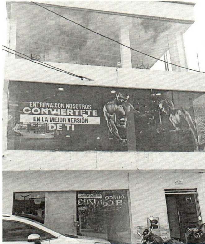
Registro fotográfico suscriptor 95447, ubicado en la dirección CRA 9 N 9 41