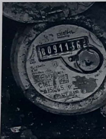
Lect 911 – 31 diciembre/2021