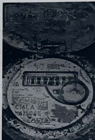
Lect 875 – 1 diciembre/2021