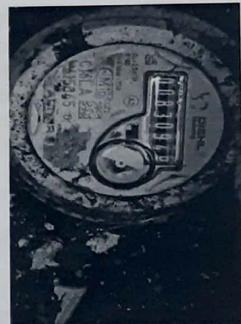
Lect 830 – 1 noviembre/2021

Propiedad de ACUAVALLE S.A. - E.S.P. - Prohibida su reproducción Página 2